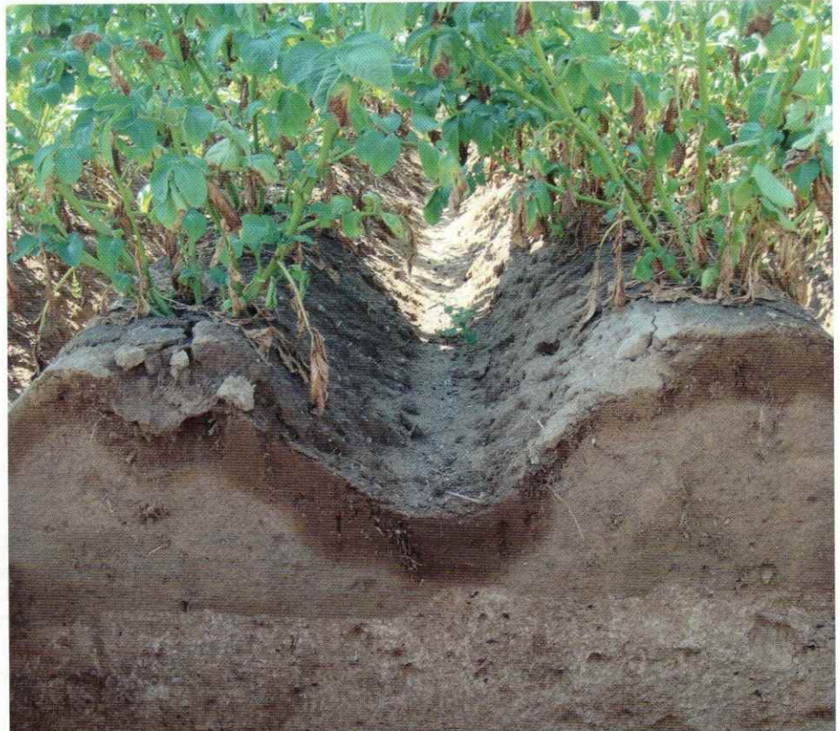
Trockener Damm nach einem Niederschlagsereignis (10 mm). Aufgrund der trockenen Bedingungen kann das Wasser den Damm nicht bis an die Wurzeln durchdringen und den Trockenstress der Kartoffelpflanzen merklich verringern.

Während seiner rund viermonatigen Wachstumsperiode verbraucht ein leistungsfähiger Kartoffelbestand (Speisekartoffeln) im Mittel der Jahre rund 430 mm Wasser. Das Wasser muss aus dem pflanzenverfügbaren Bodenvorrat und Niederschlägen stammen oder ggf.